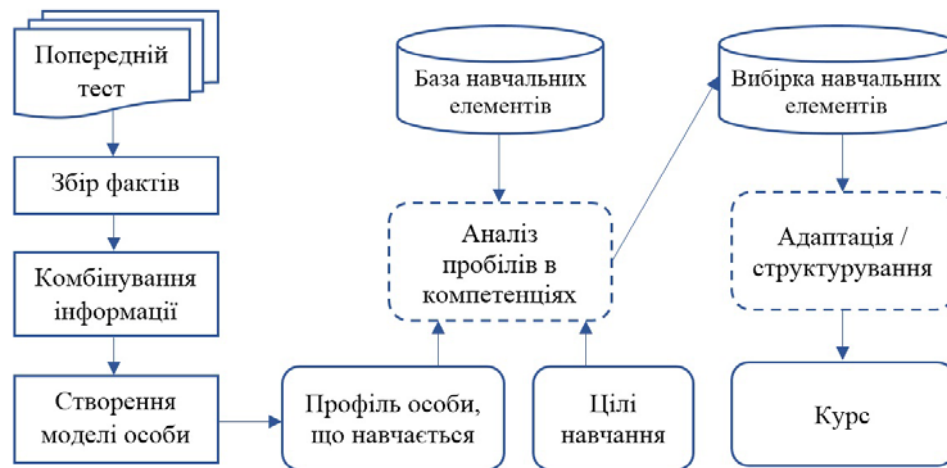
Рис. 3 – Адаптивна модель генерації контенту на основі компетенцій