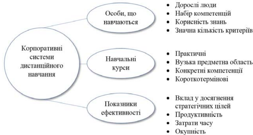
Рис. 1 – Характерні особливості корпоративних систем дистанційного навчання

осіб дуже важко перевірити за допомогою звичайних тестів, адже ці компетенції сформовані у результаті дії значної кількості різноманітних факторів – робочого досвіду, життєвого досвіду та формального навчання. Для досягнення дорослими студентами так званого навчального потоку (стан зосередження, повного залучення і націленості на успіх [13]) та навчальних результатів найбільш важливими факторами є те, наскільки корисними вважаються знання / навички, які будуть отримані в результаті навчання та легкість використання системи [14]. Крім того, модель дорослих учнів повинна враховувати значну кількість критеріїв, про які вже йшла мова вище.