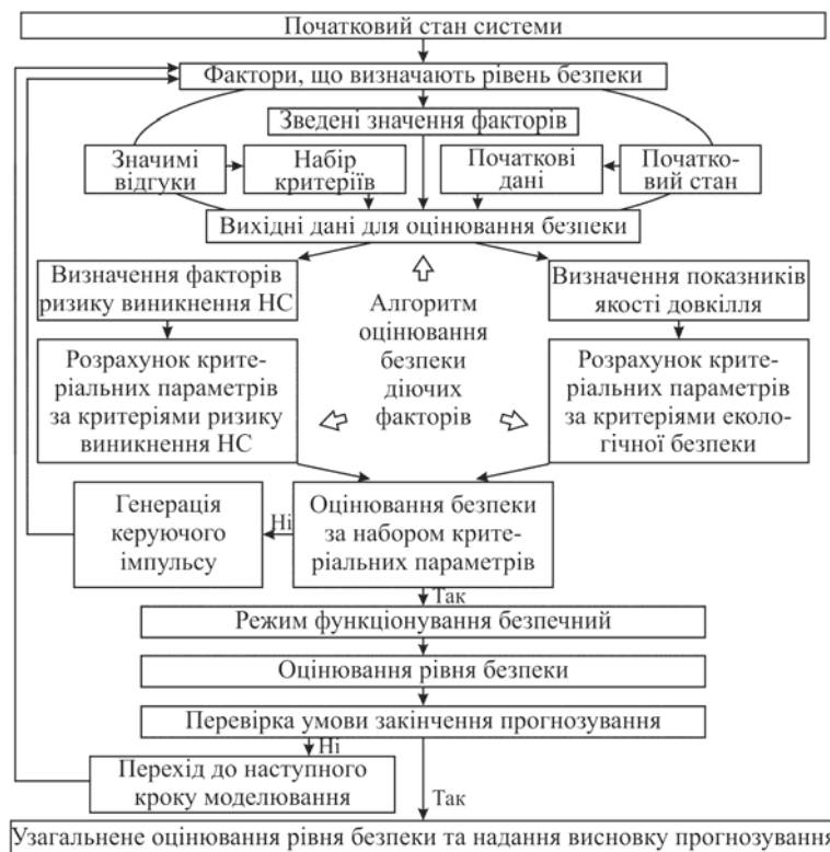
Рис. 2 – Спрощена схема методу прогнозування рівня безпеки полігону зі зберігання ТПВ

Оскільки реальні умови функціонування природних процесів у навколишньому природному середовищі характеризуються впливом складного комплексу негативних факторів, оцінювання результату їхньої дії має базуватися на сформованих динамічних моделях виникнення відгуків навколишнього середовища під дією тих або інших факторів. З урахуванням цього метод прогнозування рівня безпеки полігону зі зберігання ТПВ полягає у покроковій перевірці дотримання умов безпечного функціонування об'єкту на основі критеріїв безпеки у n -вимірному просторі факторів F_i \in \Phi , i = 1 \dots n , де n – кількість факторів у сукупності, які змінюються за програмою функціонування об'єкту, з наданням узагальненого висновку про рівень безпеки. Спрощену схему методу подано на рис. 2.