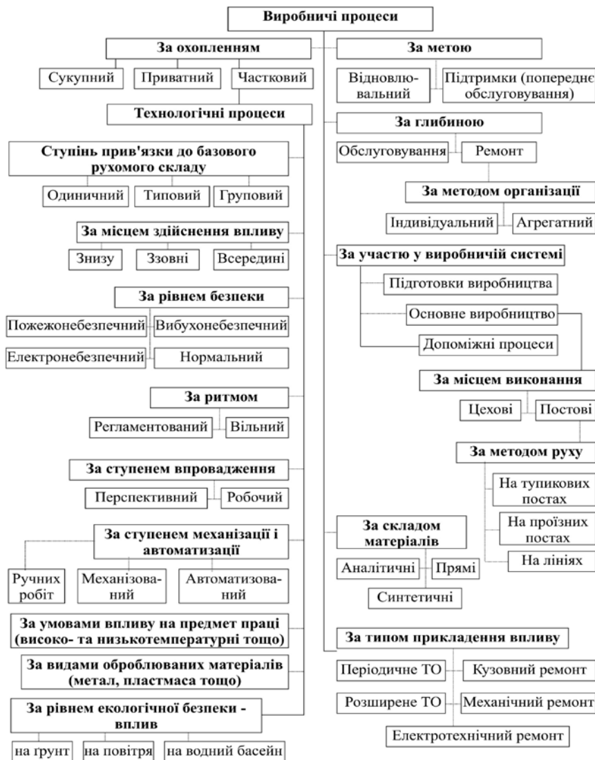
Рис. 1 – Структура виробничих процесів ТО та Р на ПАТ

ція полягає в використанні загальної системи показників, що установлює зрозумілі зв'язки між очікуваннями споживачів (рис. 2) та потенціалом виробництва [16].