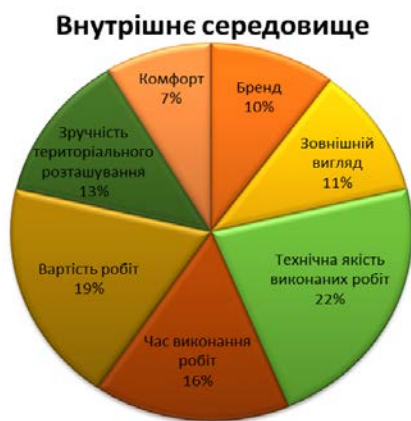
Рис. 3 – Розподіл важливості за факторами внутрішнього середовища

Існуючі методи оцінки якості послуг на основі задоволеності споживача треба адаптувати до специфіки діяльності ПАТ шляхом адаптації опитувань до термінології підприємства. Найбільш прийнятною для ПАТ є поєднання методів «SERVQUAL», «SERVPERF» І «ЗОНИ ТОЛЕРАНТНОСТІ». Сигнальною системою для виявлення проблем на виробництві, доцільно використовувати метод «КРИТИЧНИХ ВИПАДКІВ».