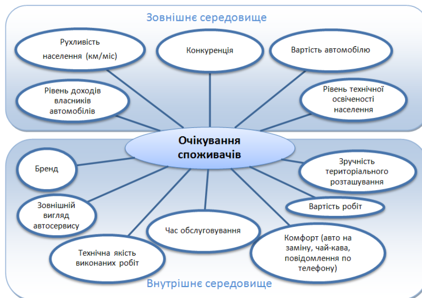
Рис. 2 – Фактори, що формують очікування споживачів [17]