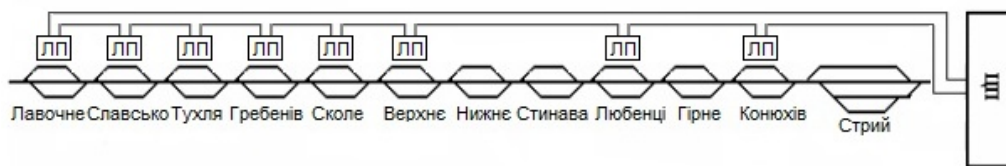
Рис. 1 – Структурна схема локальної мережі зв'язку МСДЦ «Каскад» дільниці Стрий – Лавочне

Запропоновано лінійні пункти (ЛП) об'єднати з центром пунктом управління (ЦП) за допомогою кільцевих мереж зв'язку лінійних пунктів, які використовують виділені канали або фізичні лінії магістрального кабелю, як наведено на рис. 1.