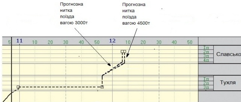
Рис. 2 – Вплив маси поїзда на прогнозу нитку ГРП в МСДЦ «Каскад»

На рис. 1 зображена залежність часу ходу поїзда від його маси, різниця коливається в межах 1–2 хвилин на одному перегоні.