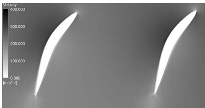
Рис. 2 – Фрагмент мгновенного поля скорости при обтекании решетки профилей для углов атаки i = -5^\circ и числа Маха M = 0,729

На рис. 2 показан фрагмент мгновенного поля скорости при обтекании решетки профилей для угла атаки i = -5^\circ и числа Маха M = 0,729 , полученного путем численного эксперимента с использованием модели турбулентности SST. В случае больших дозвуковых скоростей ( M_1 > 0,5 ) вследствие проявления эффекта сжимаемости изменяется поле скоростей в решетке. При этом увеличиваются градиенты скоростей вдоль линий тока, изменяется форма линий тока, а также смещаются области максимальных и минимальных скоростей. На рис. 2 можно видеть, что горло межлопаточного канала (сечения с минимальной площадью «живого сечения») сдвигается вниз по потоку. На рис. 3 представлены результаты расчетных исследований режимов «запирания» решеток аэродинамических профилей