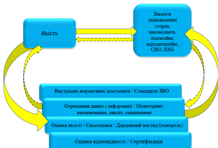
Рис. 1 – Схема забезпечення якості

Тому для забезпечення сталого розвитку ЗВО мають управляти якістю надання освітніх послуг. Управління якістю пов'язане з формуванням політики та встановленням цілей у сфері якості, визначенням процесів задля досягнення цих цілей через планування, забезпечування, контролювання та поліпшування якості. Розглянемо більш детально складову частину управління якістю – забезпечення якості, яка зосереджена на створенні впевненості в тому, що вимоги щодо якості буде виконано [11]. На рис. 1 представлено схему забезпечення якості.